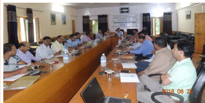
25 अगस्त, 2018 को वन वृत्त कुल्लू में परियोजना द्वारा उन्मुखीकरण कार्यशाला का आयोजन किया गया।