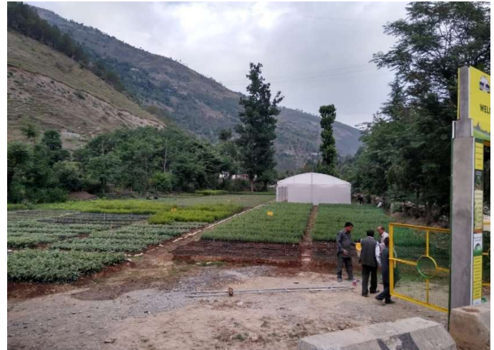
Seedlings developed at Sainj Nursery, Theog Forest Division under JICA Assisted Project

The infrastructure of fifty-nine (59) nurseries have been upgraded for enhancing seedling production and to provide high-quality seedlings of local/regional species for the plantations under the project.