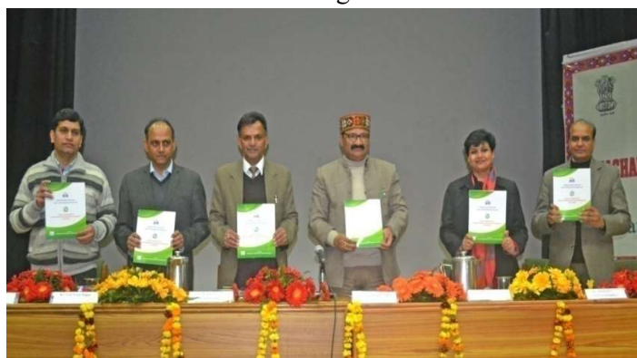
Release of Project Operational Manual by Sh. Govind Singh Thakur, Hon'ble Forest Minister H.P. on the occasion of strategic review & planning workshop on 15 January 2019, at Shimla