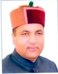
जय राम ठाकुर