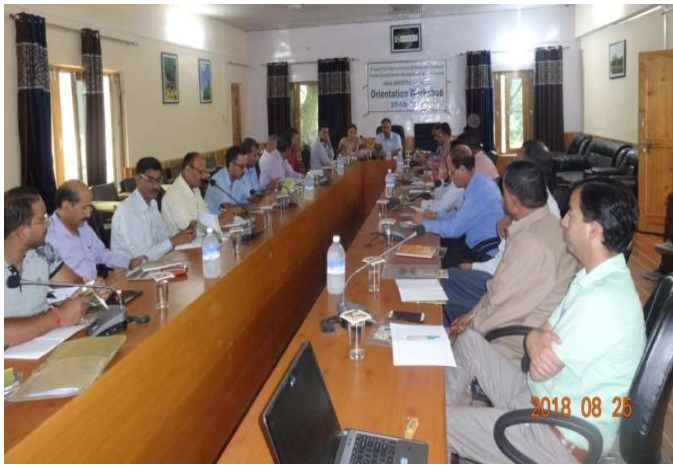
Orientation workshop conducted on 25 August 2018, at Circle office, Kullu