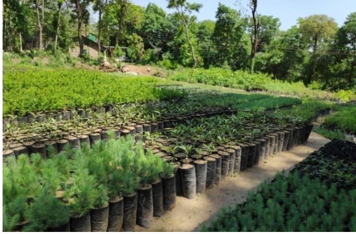
चौतड़ा पौधशाला, जोगिन्द्रनगर वन मण्डल, JICA पोषित परियोजना

परियोजना में विभिन्न श्रेणियों के कुल 156 स्वीकृत पदों में से 14 अधिकारी व कर्मचारी वन विभाग से प्रतिनियुक्ति के आधार पर (Secondment basis) तथा 78 अनुबन्ध कर्मचारी हिमाचल प्रदेश प्राकृतिक संसाधन समिति सोलन व अन्य एजेन्सी से लिए गये हैं।