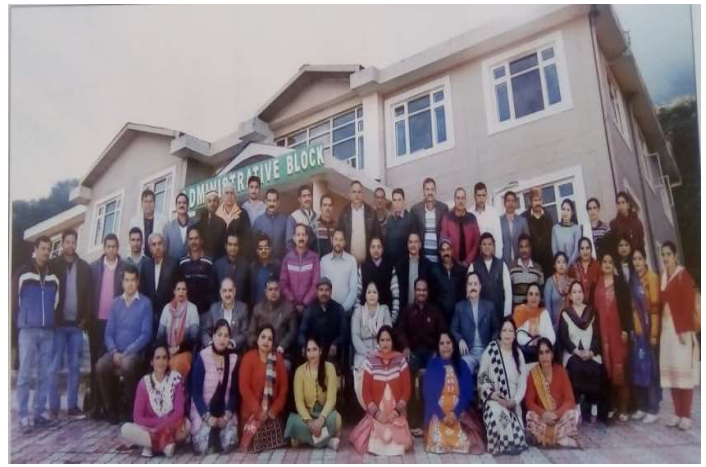
Training conducted for Front line staff on 18-19 March 2019, at FTI, Sundernagar