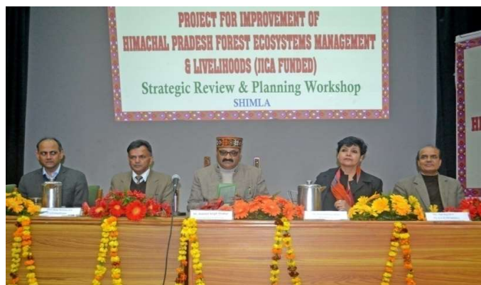
Strategic Review & Planning workshop on 15 January 2019, at Shimla