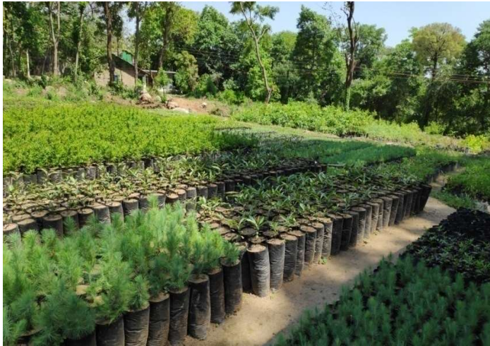
Chauntra Forest Nursery, Joginder Nagar Forest Division under JICA Assisted Project

Total 156 nos. of post of various categories were approved for the project. Out of the total 14 Personnel have been deployed from Forest Department on secondment basis and 78 Personnels hired from HPNRMS, Solan/ Open market.