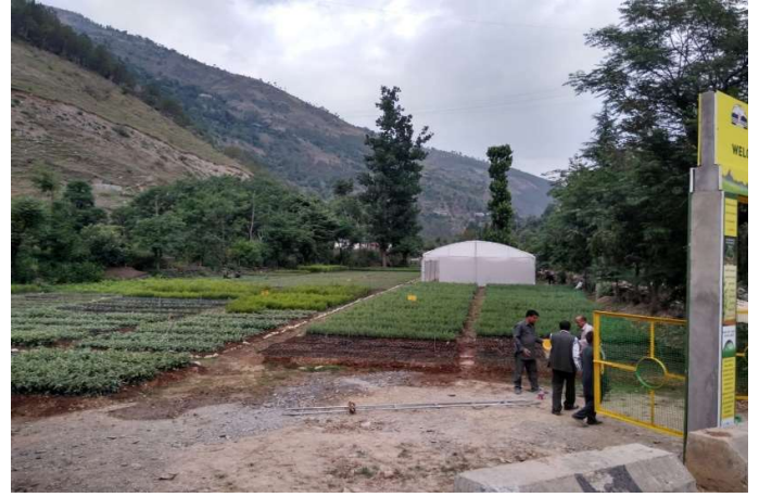
सैन्ज पौधशाला, ठियोग वन मण्डल, JICA पोषित परियोजना

परियोजना में स्थानीय व क्षेत्रीय प्रजातियों के उच्च गुणवत्ता वाले पौधों के उत्पादन के लिए 59 पौधशालाओं का उत्थान किया गया ताकि इन पौधशालाओं की पौध उत्पादन क्षमता व गुणवत्ता को बढ़ाया जा सके। परियोजना में 5 सैन्ट्रल पौधशालाएँ तथा 54 परिक्षेत्र स्तरीय पौधशालाएँ सम्मिलित हैं।