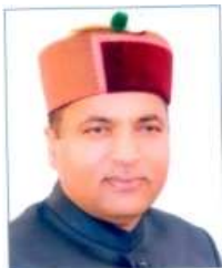
JAI RAM THAKUR