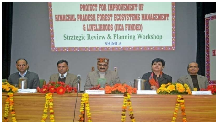
15 जनवरी, 2019 को शिमला में आयोजित नीति समीक्षा और योजना कार्यशाला।