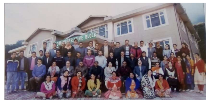
18-19 मार्च, 2019 को वन प्रशिक्षण संस्थान सुन्दरनगर में परियोजना के अग्रिम पंक्ति कर्मचारियों को परियोजना कार्यान्वयन का प्रशिक्षण प्रदान किया गया।